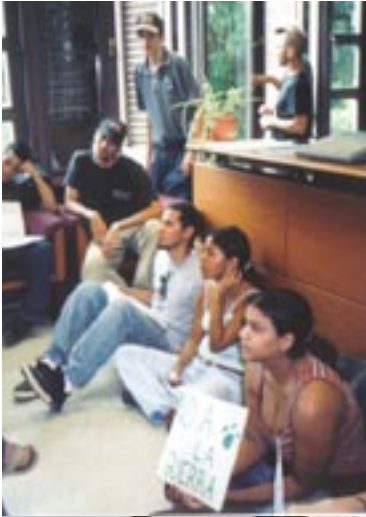
25 de noviembre de 2003 Integrantes del Campamento Colegial y del FUDE realizan demostración pacífica tipo “sit-in” en la oficina del Rector del Recinto de Mayagüez exigiendo se atiendan sus reclamos.