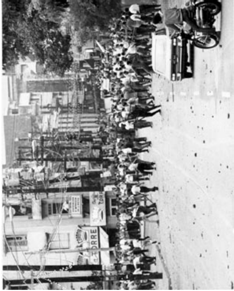
No aparece fecha ni descripción de la foto en el archivo digital. Sin embargo, por los sucesos y el fotógrafo, se infiere la foto es del 7 de noviembre de 1969, cuando partidarios y opositores al ROTC se enfrentan dentro y frente de la UPR, con el saldo de 24 heridos.