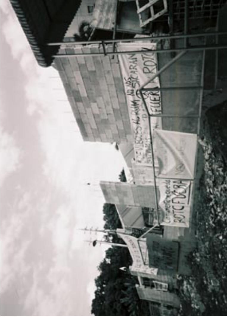
Campamento Colegial - Universidad de Puerto Rico, Recinto de Mayagüez

15 de septiembre de 2003- 19 de marzo de 2004