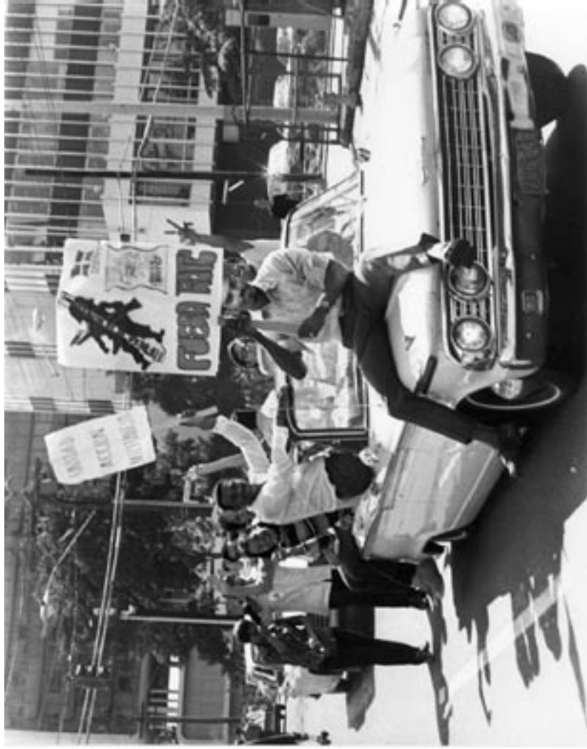
En el archivo digital aparece bajo la nota de marcha de la FUPI a la Fortaleza. Sin embargo, bajo este título aparecen también otras fotos que corresponden a la marcha contra el Servicio Militar Obligatorio y del ROTC celebrada el 29 de octubre de 1969.