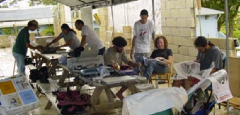
Campamento Colegial - Universidad de Puerto Rico, Recinto de Mayagüez Integrantes del campamento trabajando en material informativo y educativo. fecha de fotos- octubre de 2003