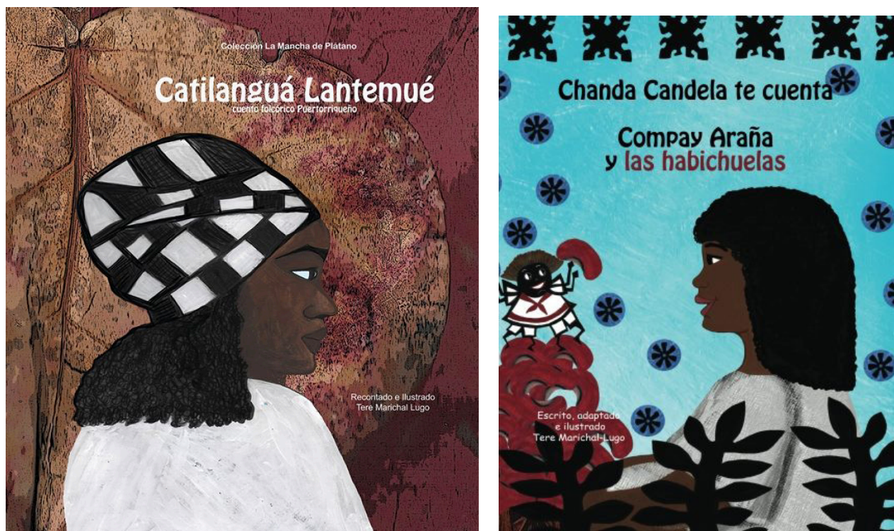
Figuras 5 y 6. Portadas de los libros de Tere Marichal “Catilanguá Lantemué” y “Compay Araña y las habichuelas”