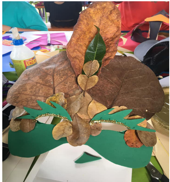
Figuras 3 y 4. Máscaras hechas por niños y niñas en el sur de Puerto Rico en febrero de 2020.